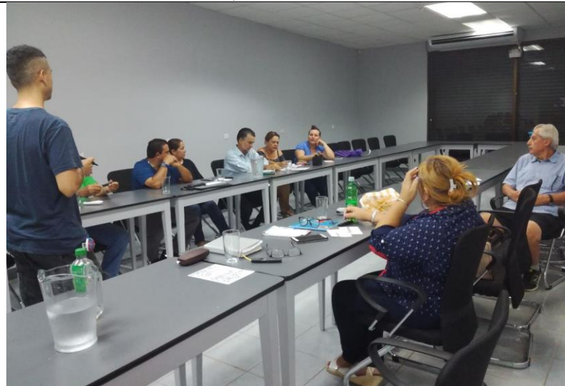
Taller diagnóstico Participativo con Comunidad. Palmar 17.07.17