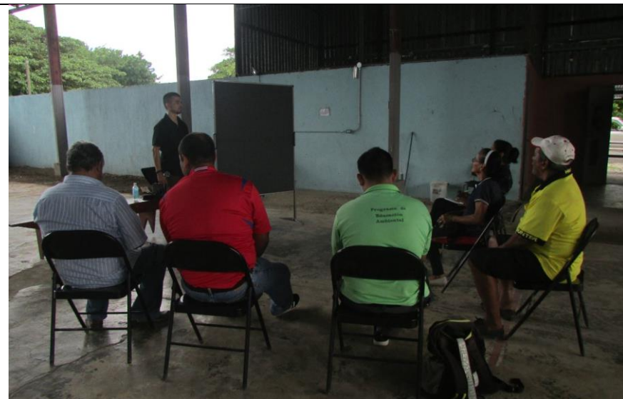
Taller diagnóstico Participativo con Comunidad. Sierpe 05.09.17