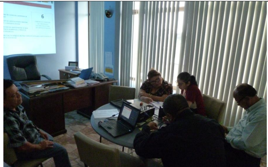
Taller de Validación Política Local Seguridad con Comisión Municipal. Cortés 05.12.17