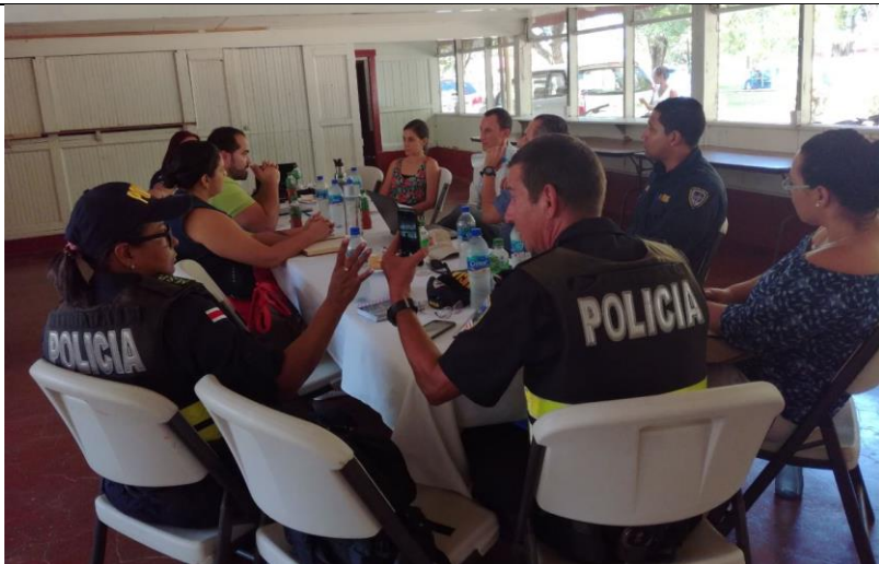
Proyecto Seguridad Integral y Prevención de Violencia PNUD/Municipalidad/MSP/CACOBA 17.02.17