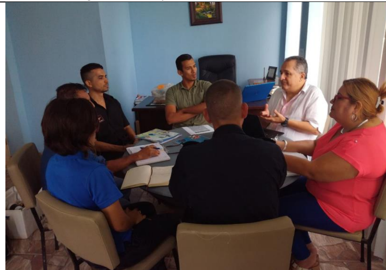
Reunion Planificación Proyectos Prevención. Comisión Municipal / PNUD 19.07.17