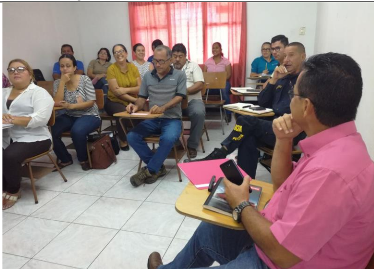
Taller diagnóstico Participativo con representantes CCCI. Cortés 20.07.17