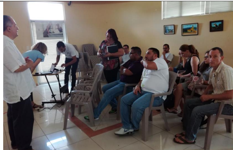
Proyecto Seguridad Integral y Prevención de Violencia, experiencia Curridabat PNUD/Municipalidad/MSP/CACOBA 17.03.17