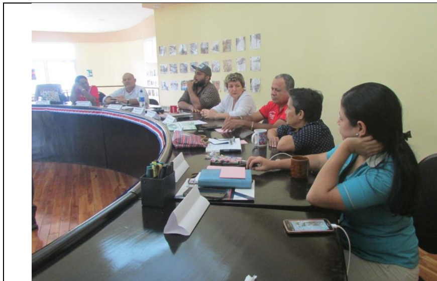
Taller Planificación Política Local Seguridad. Concejo Municipal 05.09.17