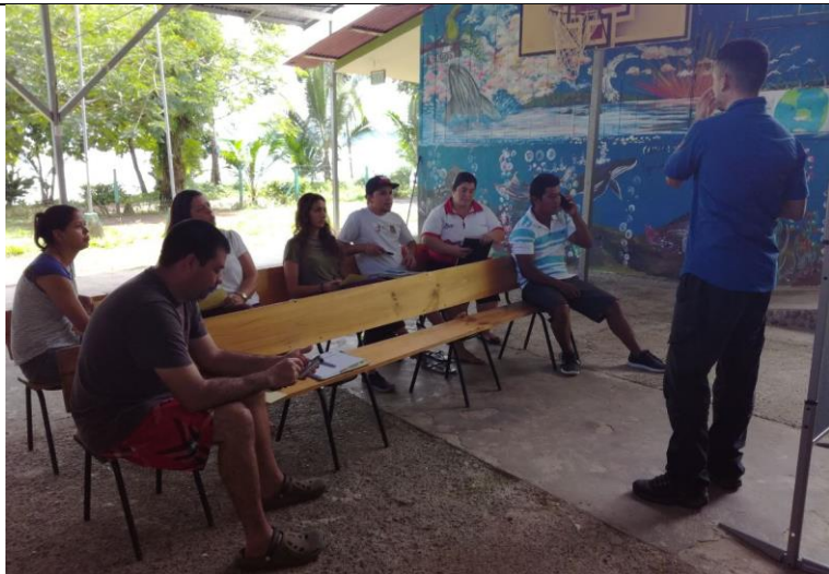
Taller diagnóstico Participativo con Comunidad. Palmar 18.07.17