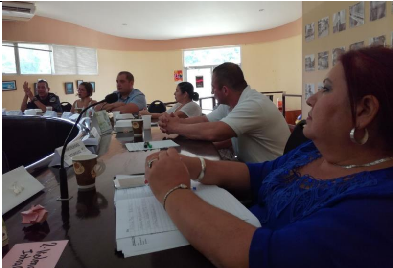
Taller construcción de Plan Operativo 2017. Comisión Cantonal de Seguridad 11.05.17