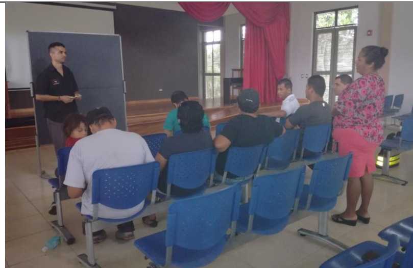
Taller diagnóstico Participativo con Comunidad. Cortés 19.07.17