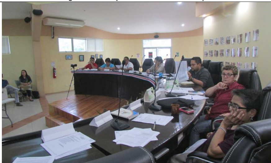
Taller de Validación Política Local Seguridad con Concejo Municipal. Cortés 15.11.17