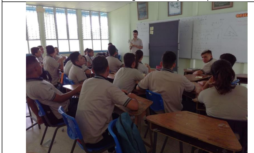
Taller diagnóstico Participativo con Jóvenes Liceo Pacifico Sur. Cortés 18.10.17