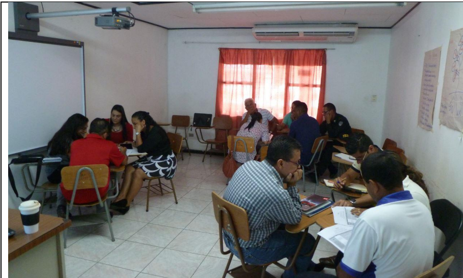
Taller de Validación Política Local Seguridad con representantes CCCI. Cortés 16.11.17