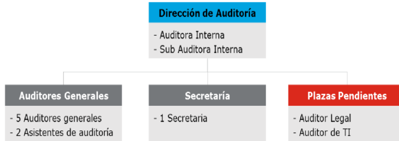
Figura 3. Organigrama de la AI

Actualmente, la Auditoría Interna del MJP cuenta con 10 funcionarios en total. La estructura organizativa se detalla en la siguiente figura.