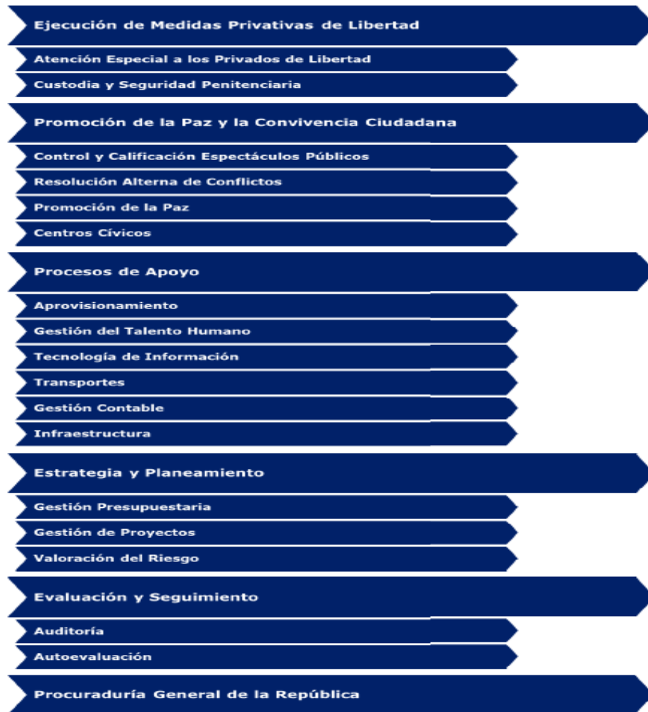
Figura 2. Procesos del MJP

La siguiente figura resume la estructura de procesos identificada: