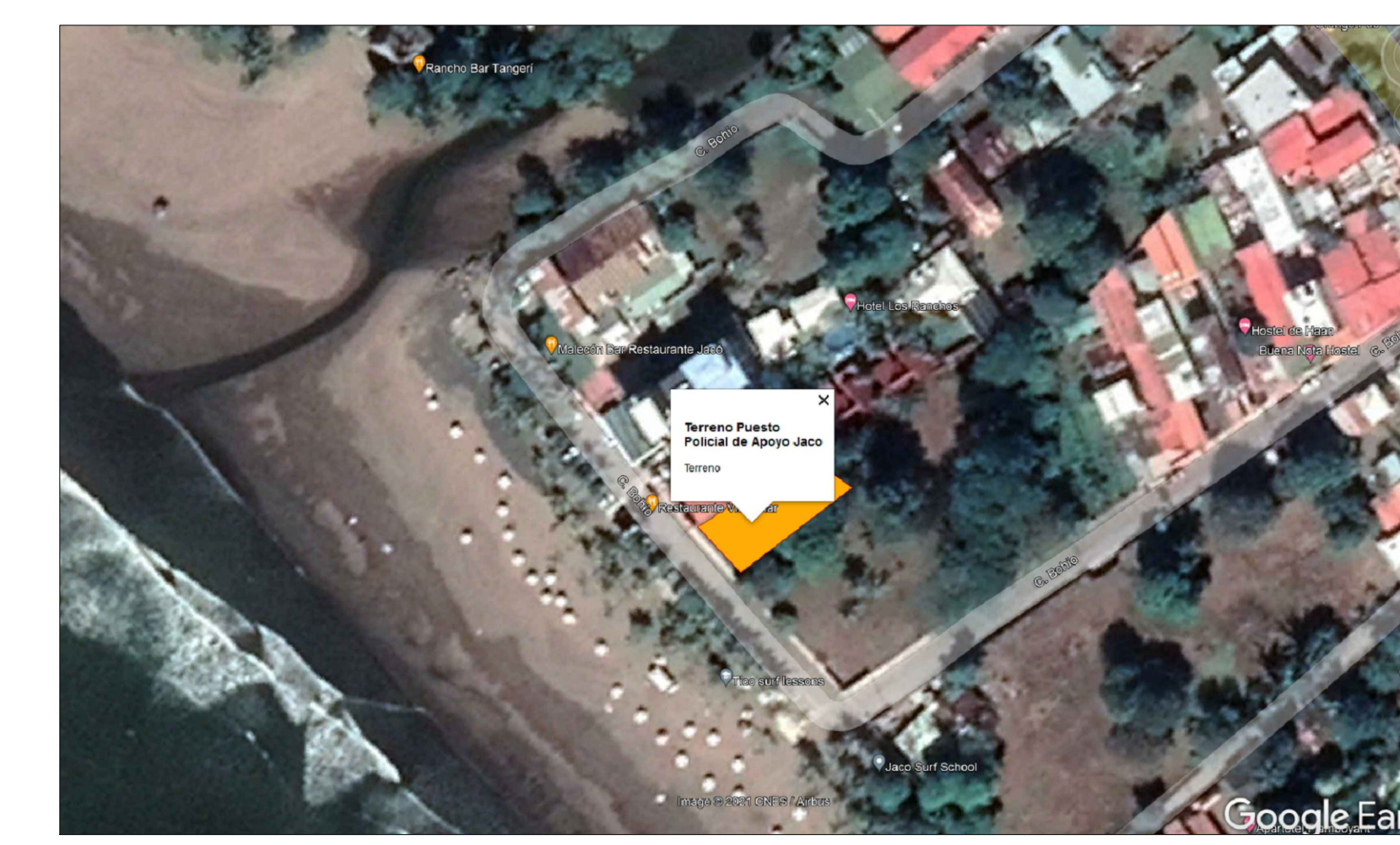
APUNTE DE UBICACION