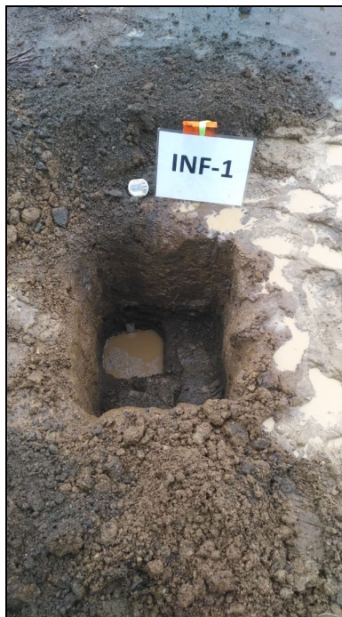
Fotografía. Vista de prueba INF-1.