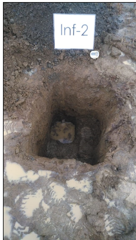
Fotografía. Vista de prueba INF-2.